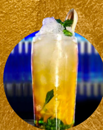
MARGARITA AL PASTOR