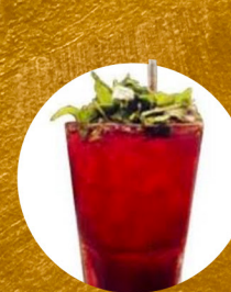
THE FORGOTTEN EXPLORER